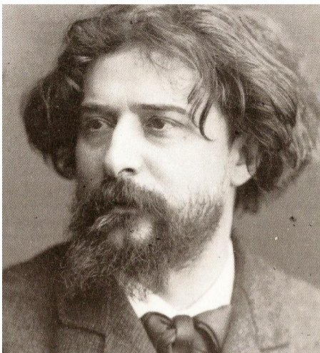
Alphonse Daudet. Palais des Roures, Avignon

S'il a eu une carrière essentiellement parisienne, Alphonse Daudet, né à Nîmes en 1840, reste pour le grand public d'aujourd'hui un auteur provençal des Lettres de mon moulin et de la série des Tartarin . Lorsqu'il s'attèle à l'écriture de son